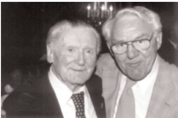
Zwei Virtuosen unter sich – Jenő Takács und Ludwig Streicher, 1999